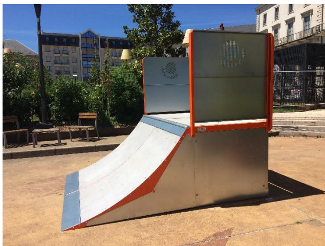
Garde-corps tôlerie Carénage magnélic en option