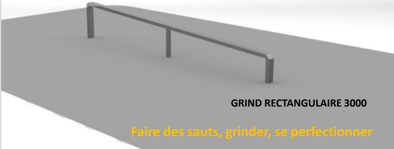
GRIND RECTANGULAIRE 3000

Faire des sauts, grinder, se perfectionner