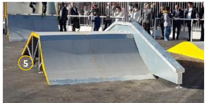
Config ESCONF L900 LARG2400 Mur ESMUR L900