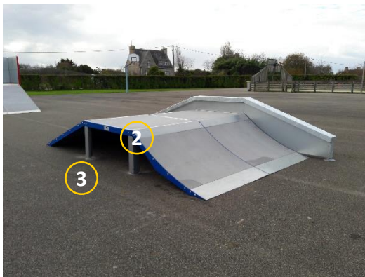
Config ESCONF M600 LARG2400 Mur ESMUR M600